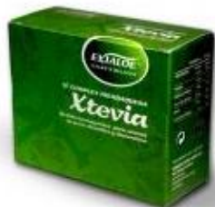
Cajas de 20 y 100 sobres Con Hierbabuena